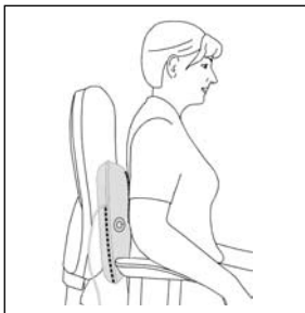
Массаж спины: нижняя часть спины (поясничный отдел позвоночника)